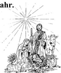
Ullrich Gaigl 1. Bürgermeister