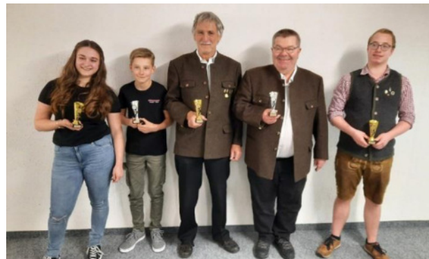
Die Meister der verschiedenen Klassen: