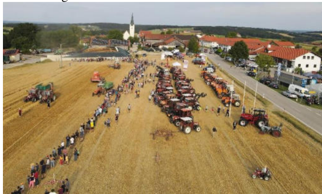
Fiat-Feld in Schönbrunn

Die MMC Schönbrunn war Veranstalter des Fiat-Feldtags von 13. Aug. in Schönbrunn.