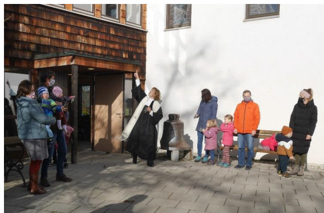
Bild Glockenläuten Nov20